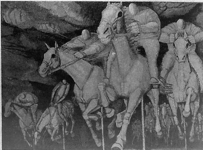
ДВИЖЕНИЕ № 1